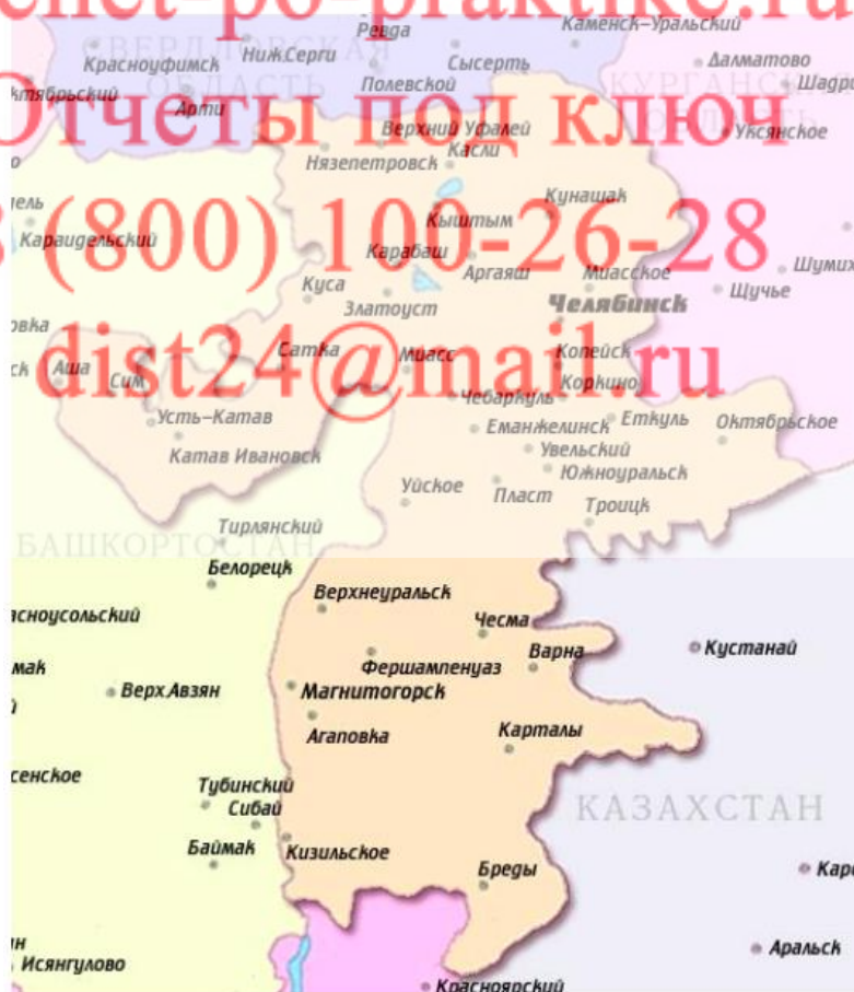
Рисунок 1 – Территория Челябинской области

Численность населения Челябинской области на 01.01.2019 г. – 3 475 727 человек. В городах области проживает 2 874 959 человек, в сельской местности – 600 768 человек.